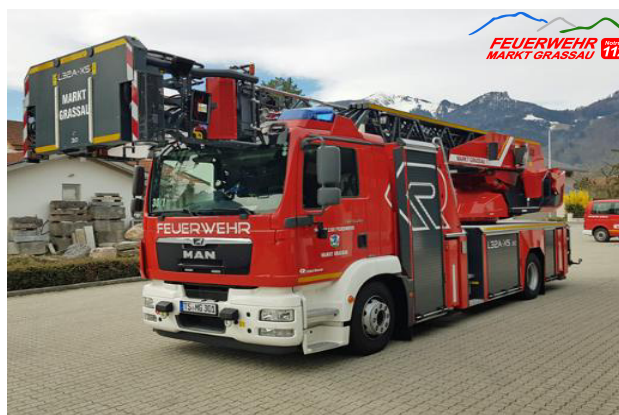
Florian 30/1, Grassau

Nach so viel Action können wir uns bei einer Brotzeit ausruhen, damit ihr gestärkt wieder abgeholt werden könnt.