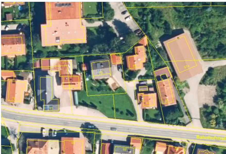
Abb. 1: Plangebiet mit Umgebung, Quelle: Bayernatlas

Der Änderungsbereich liegt an der Bahnhofstraße. Er ist derzeit unbebaut und als Garten genutzt, ein Teil der Fläche ist befestigt und dient als Zufahrt zu den dahinterliegenden Grundstücken.