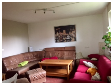
Chillbereiche Parterre und 1. Stock