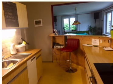
Küche mit Thekenbereich

Ein weiteres Highlight ist die Mithilfe bei dem Grassauer Kinderfasching und die Halloweenpartys oder Märchenfeste für die Jüngeren im Jugendtreff.