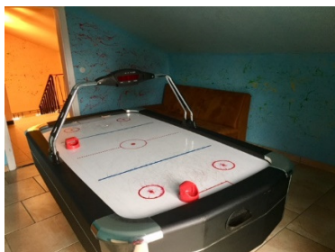
Airhockeytisch, sowie Kickertisch (im Keller)

Die Jugendlichen des Treffs engagieren sich bei vielen Gelegenheiten im Gemeindeleben.