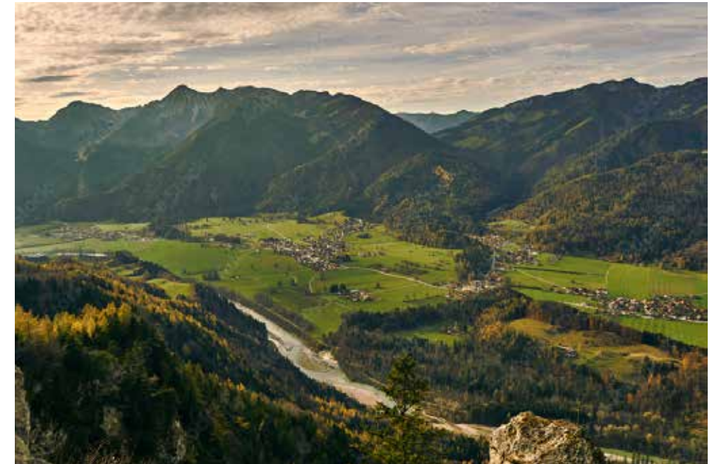
Das Achantal steht am Anfang einer digitalen Revolution dank eines innovativen Glasfasernetzwerks.